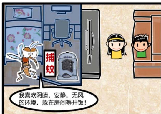
大厅活动，房间捕蚊